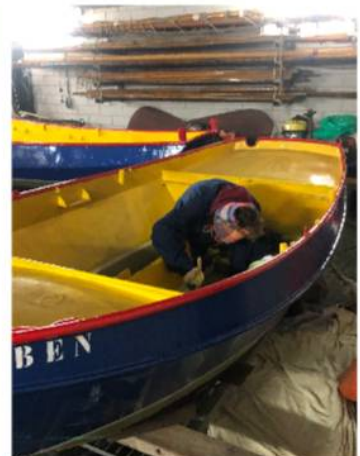
Onderhoud aan de 25 jaar oude Juniorvletten.