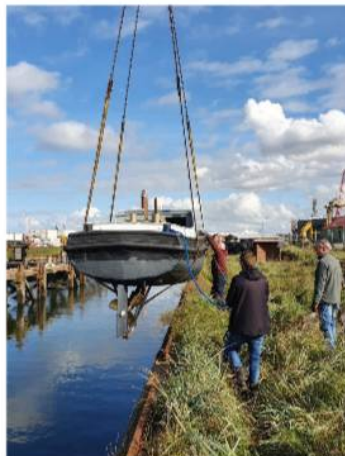
De sleper gaat te water bij Scheepswerf van Laar.