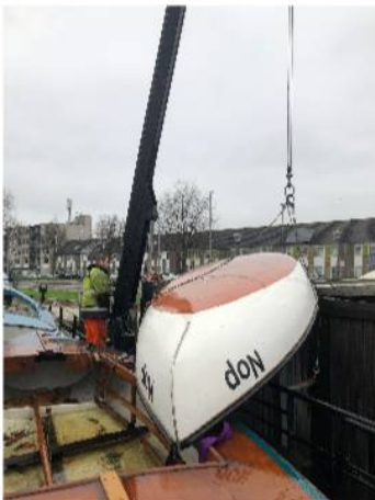
Winterstorm blaast BM van Vertrouwen.