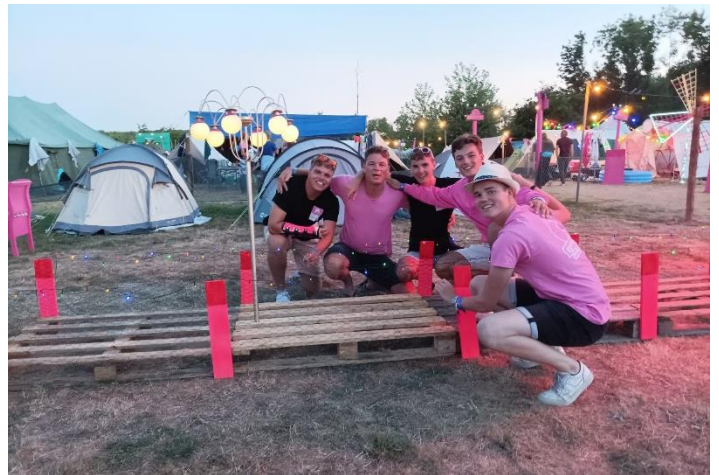
Niet nader te benoemen groep uit Velsen hangt een slotje aan de brug van de Wilde Vaart.

Als een echt Parijze brug moesten hier natuurlijk slotjes aan gehangen worden door mensen die van elkaar houden. De leden van deze niet nader te noemen groep uit Velsen toonde hun liefde voor elkaar door samen slotjes aan de brug te hangen.