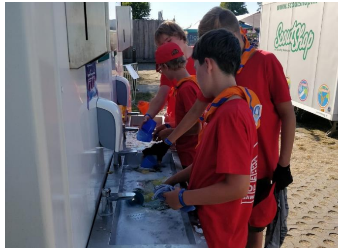
De verkenners maken efficiënt gebruik van de voorzieningen op het Nawaka.

Meest centrale toiletgroep De verkenners wisten gisteren af en wilde heel Nawaka laten meegenieten. Ze mochten zelf een afwasplek uitkiezen, dus kozen ze ervoor om alle gootstenen bij de wc bezet te houden. Wc-gangers (met ongewassen handen) stonden vol verbazing te kijken hoe de verkenners professioneel met 2 afwasborstels snel de afwas er doorheen hielpen. Het dicht krijgen van de afvoer met wc-papier was wel veel werk. Tip van de redactie: geef mensen die naar de wc zijn geweest voorlopig geen hand.