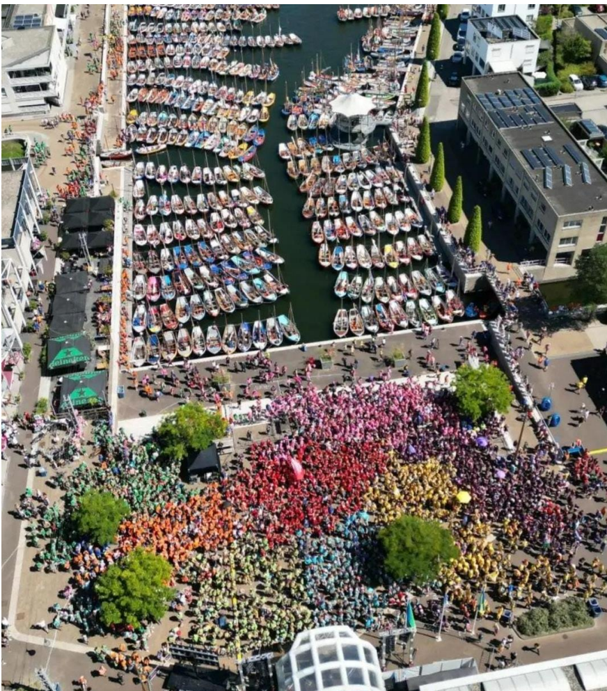
Zeewolde fleurt op door de verschillende shirts en vletten van alle deelnemers.