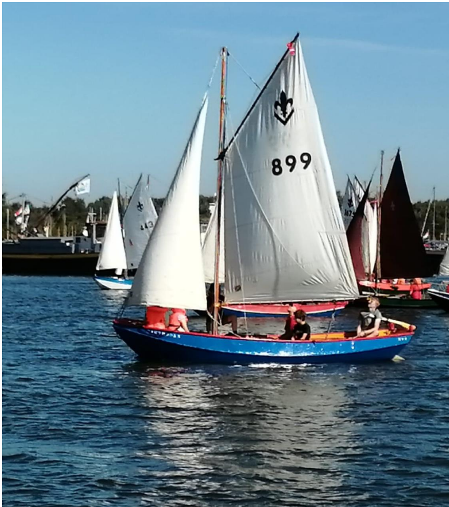
De Zeeverkenneren zijn gespot op het Wolderwijd.