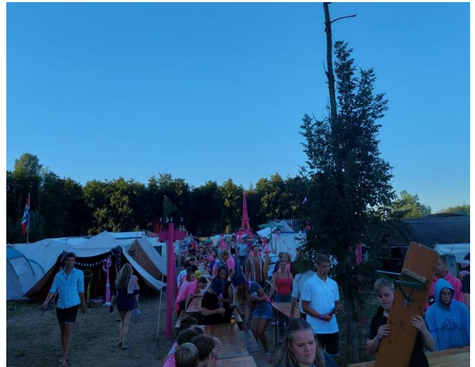
Subkamp Eiffeltoren bouwt één lange speeddatetafel.

Elke deelnemer kreeg een bingokaart met genante verhalen erop die mensen wel eens meegemaakt zouden kunnen hebben. Het doel van het spel was om tijdens je date een genant verhaal van je datepartner te ontlocken, dat je dan kon afstrepen van je bingokaart. Helaas kon de redactie geen fysieke kaart in handen krijgen.