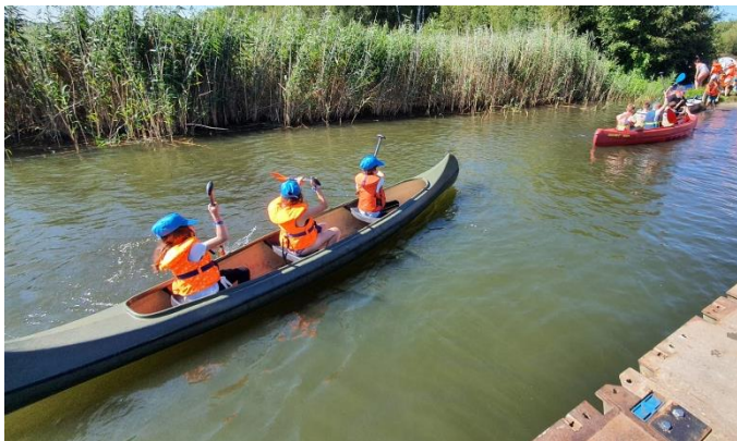
De welpen (herkenbaar aan de blauwe petjes) trainen voor de wedstrijd.

Na enkele keren oefenen in het oefengebied waren ze klaargestoomd voor de wedstrijd en wisten de welpen 2 e , 4 e en 5 e te worden uit hun pool. Een resultaat om trots op te zijn.