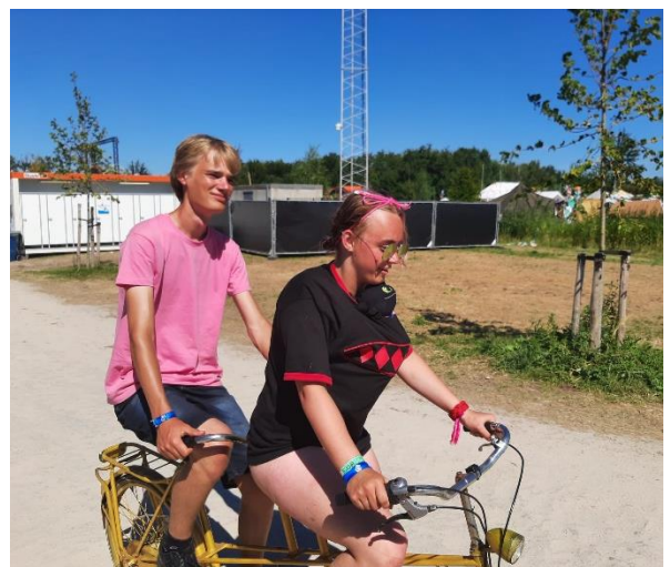
Toothless voor de zoveelste rit op de tandem, fotograaf: Wimke Teeuwen.

Aan het eind van de dag heeft toothless lekker genoten van de rust op het dek van de Vertrouwen.