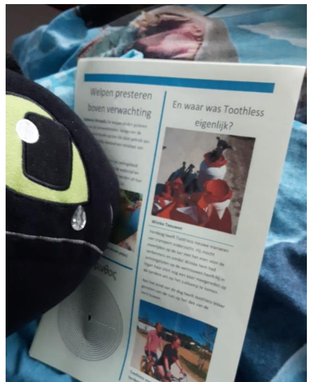
Toothless ligt huilend op het bed van Wimke bij het lezen van de Vlotte Babel.

Ondertussen mist grote Toothless Wimke heel erg en moest hij huilen door de krant. Het komt wel goed hoor Toothless!