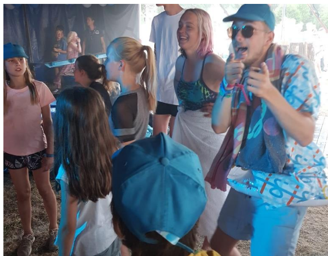
De Wilde Vaart danst erop los met de welpen op het feest ter ere van de goden.

Vol goede moed vertrokken de leden van de Wilde Vaart richting het waterspektakel om daar voor een grote teleurstelling te komen staan, het was gesloten in verband met het eindfeest van de welpen. Gelukkig is de Wilde Vaart flexibel en zijn zij dus maar lekker mee gaan feesten met de welpen.