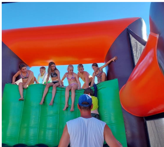
De welpen zitten klaar voor de laatste sprong van de stormbaan.