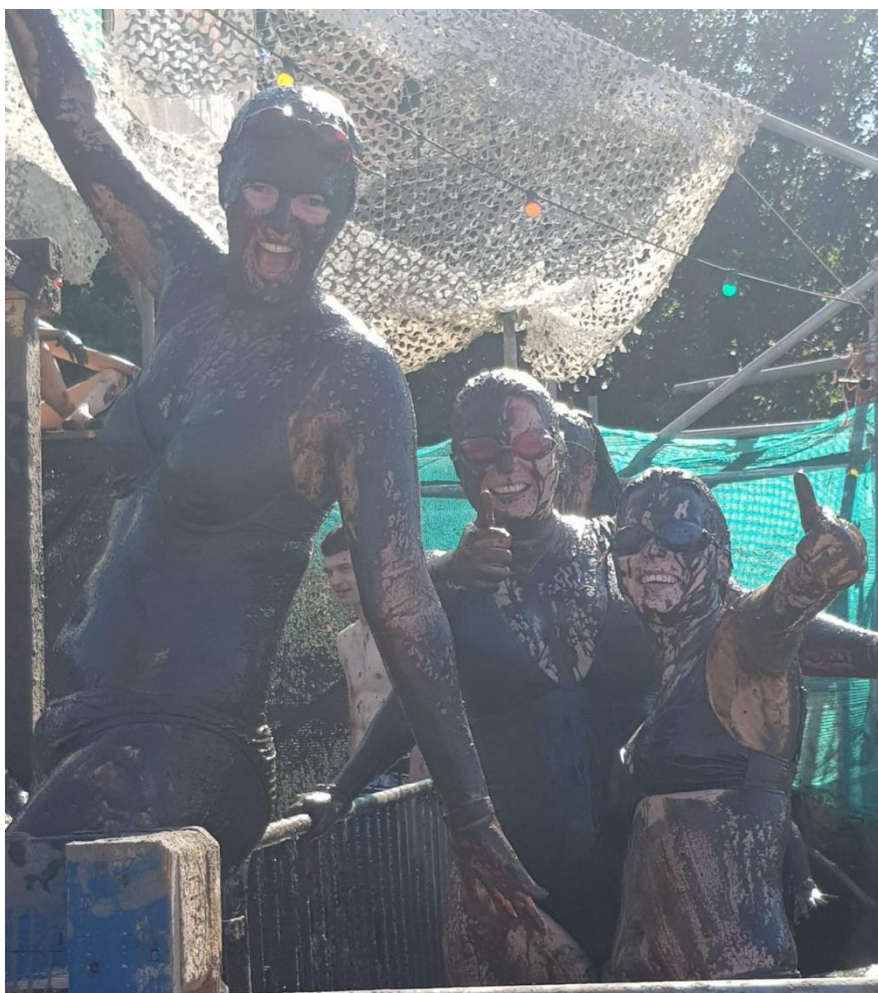
De Leiding wilde niet vies worden, maar moest verplicht mee met de welpen.