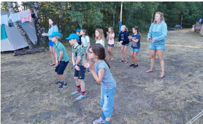
De welpen en leiding zijn lekker aan het dansen als ochtendgymnastiek.

Onder begeleiding van het lied kukumatakumahekomkommerkiloknallerkurkuma kukuma konden de welpen lekker opwarmen voordat ze gingen ontbijten.