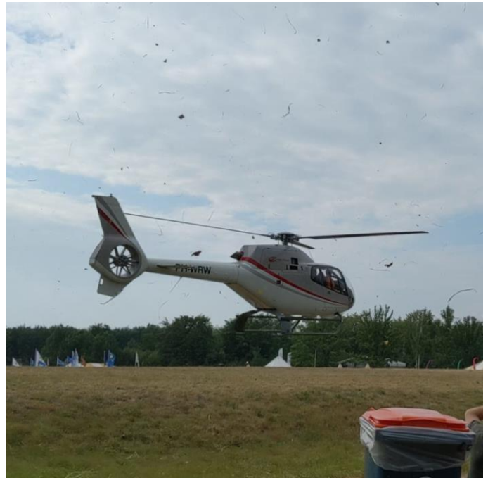
Bewijsmateriaal dat er echt een helikopter was

Toen de leiding niet veel later een foto geapt kreeg van een helikopter die voldeed aan het signalement, moest de leiding schoorvoetend toegeven dat het verhaal lijkt te kloppen.