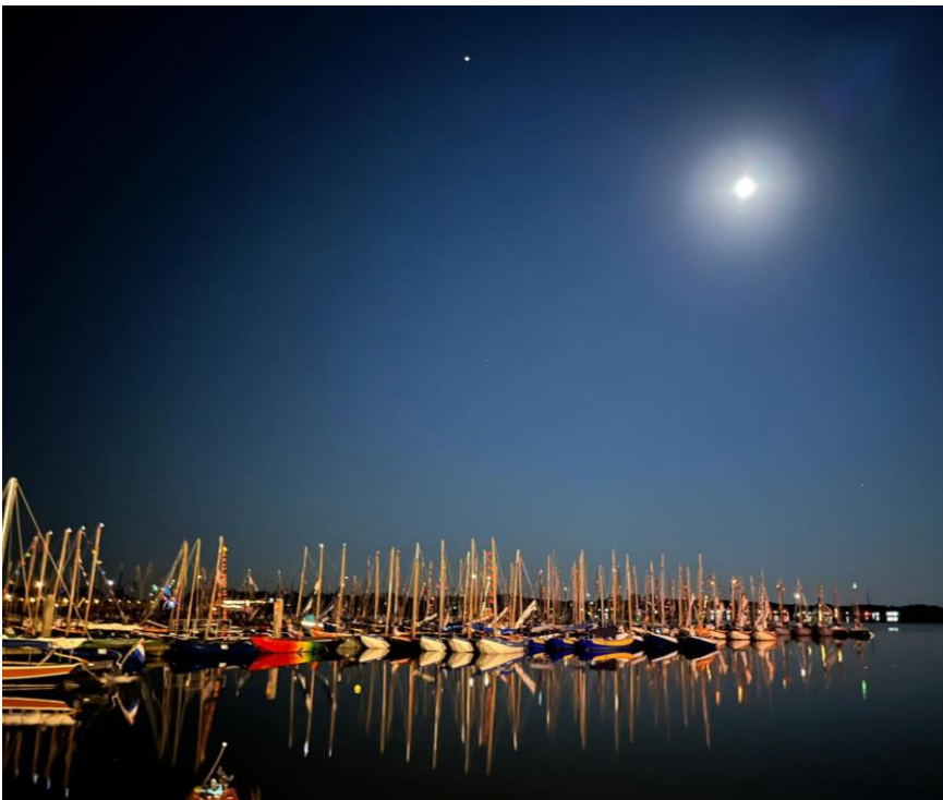
Foto van de nacht

De vele vletten op Nawaka leveren mooie plaatjes op, maar met deze maan bij heldere hemel is het helemaal prachtig.