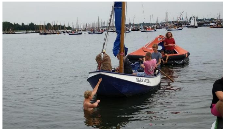
De Wilde Vaart gaat zo langzaam dat het net een foto lijkt.

Subkamp Eiffeltoren Op maandagochtend moest de Wilde Vaart zich bewijzen bij het onderdeel “trek je gek” door als eerste over de finish te roeien met een vlot vol mensen achter zich. Hoewel zij hard hun best hebben gedaan zijn zij helaas laatste geworden van hun ronde. Op de terugweg vond hun ballast dat het te lang duurde om terug bij de steiger te komen wat ervoor zorgde dat iemand uit het vlot is gesprongen om de wilde vaart lopend te slepen.