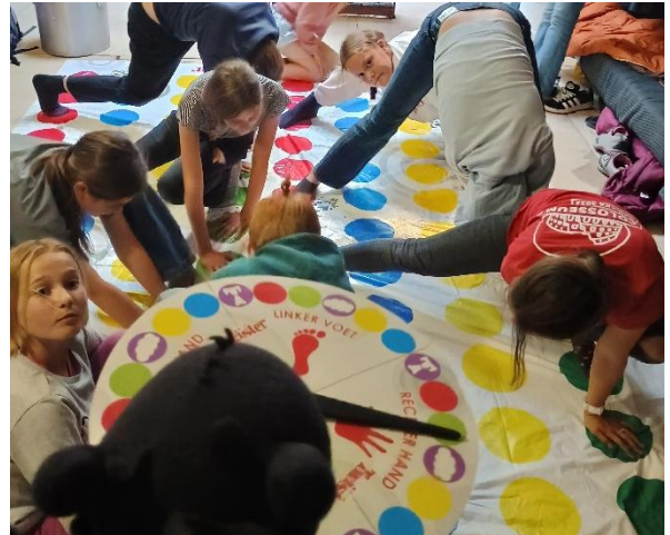
Toothless heeft gisteren meegedaan met Twister, hij wist het spel goed te leiden!